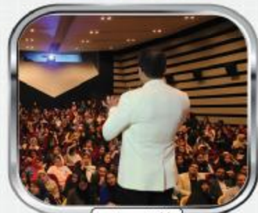
ما انرژی مثبتیم

فقط کفایت خواست و اراده ی توبه برنامه ی ما اضافه شود تا یکی از رتبه های برتر کنکور در سرای علم باشی